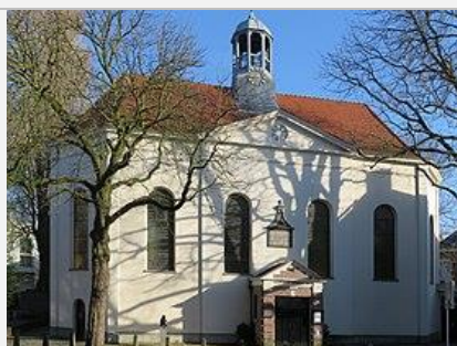
Pauluskerk Tilburg – Heuvelstraat 141

Stadsorganist van Eindhoven met medewerking van slagwerker