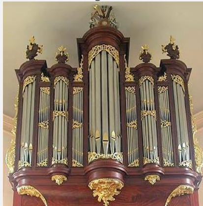
Johann Bätz-orgel Pauluskerk (1765)